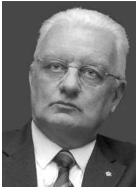
campioni assoluti 2011.

A differenza delle precedenti edizioni, questa volta sul podio non solo i vincitori delle classifiche speciali ma anche i piloti che si sono fregiati del casco tricolore; infatti, a causa della tragica scomparsa di Marco Simoncelli, avvenuta nello stesso giorno dell'ultima prova del CIV svoltasi al Mugello, la cerimonia dei titoli tricolori venne annullata e la Federazione ha scelto la grande ribalta della rassegna scaligera per premiare i