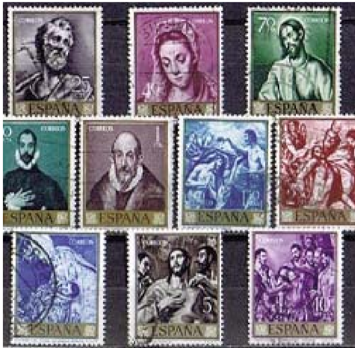
Il testo dell'articolo: Una settimana prima del convegno di Sindelfingen, Stoccarda - Fiera Internazionale del Francobollo, n.d.t. - il mondo filatelico guarda a Verona. Dal 21 al 23 ottobre avrà luogo,