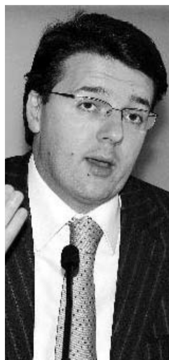
le e l'intera macchina amministrativa in quanto, se la percentuale è così alta a fine manda-

to, significa che tutti hanno lavorato bene.