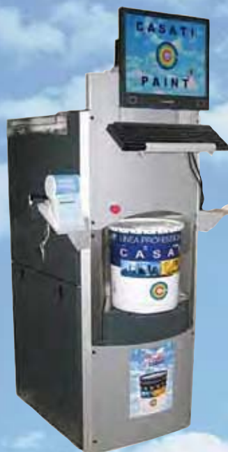
DOSATRICE AUTOMATICA Modello TM 300