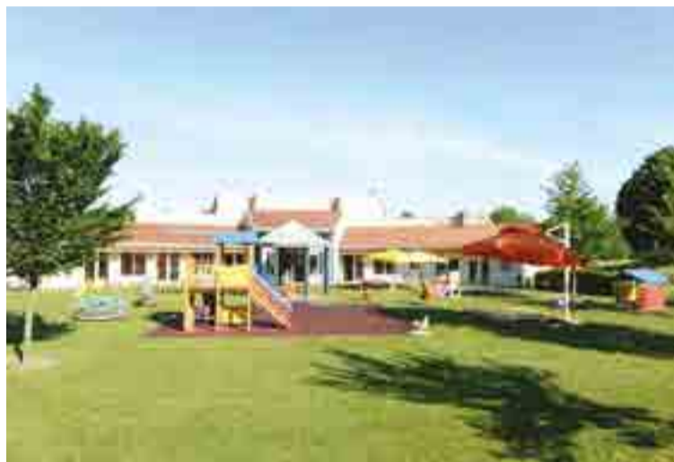
Foto Asilo nido l'Abbraccio, ubicato in zona industriale Ponte Rosso a San Vito al Tagliamento, a 1 km, in linea d'aria, dal sito Kronospan.

"Tutti i cosiddetti inquinanti atmosferici principali (ossidi di azoto, ossidi di zolfo, ozono, monossido di carbonio, piombo e Particolati), eccetto