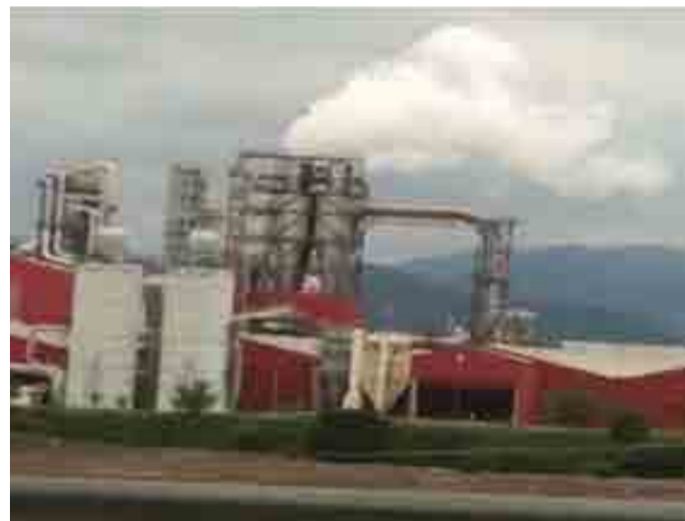
Foto sito Kronospan, in Romania

Successivamente nel 2018 l'azienda ha chiesto una proroga dell'autorizzazione già rilasciata (proroga concessa per 7 anni - 2025) con la richiesta di inserire una modifica alla realizzazione della caldaia volta al bruciare non più legno vergine bensì gli scarti