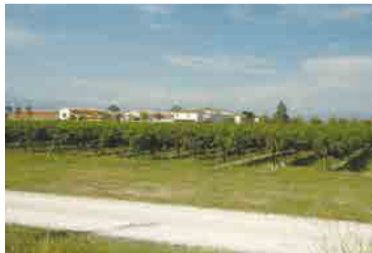
Foto Vigneti della campagna adiacente la zona industriale Ponte Rosso a San Vito al Tagliamento.

Ricordo ancora come la ricaduta al suolo per alcune di queste terribili sostanze bioaccumulabili e resistenti alla degradazione come Diossine, PCB, metalli pesanti, IPA, COV, ecc. (seppure