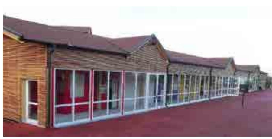
Scuola Elementare Amatrice (RI)