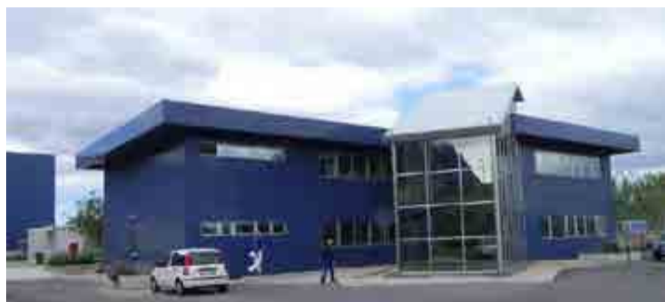
Termovalorizzatore di Acerra (NA)