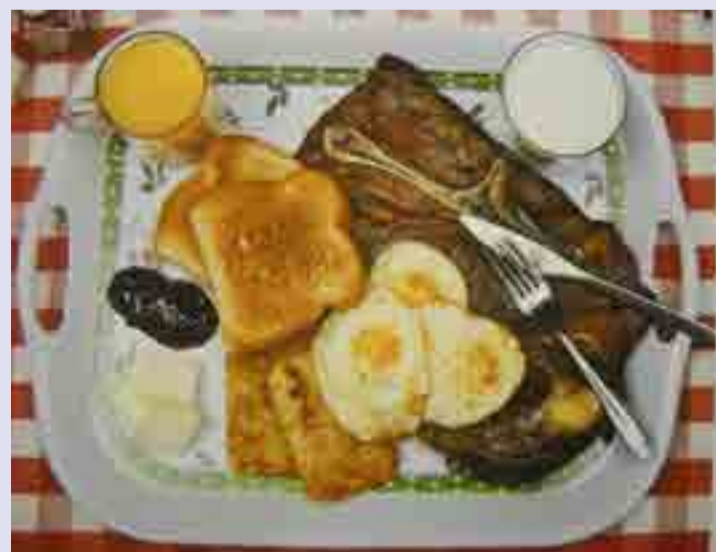
Ricostruzione fotografica dell'Ultima Cena di Ted Bundy