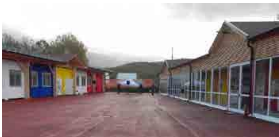
Polo studi Amatrice (RI)