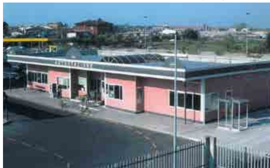
Autostazione di Caorle (VE)