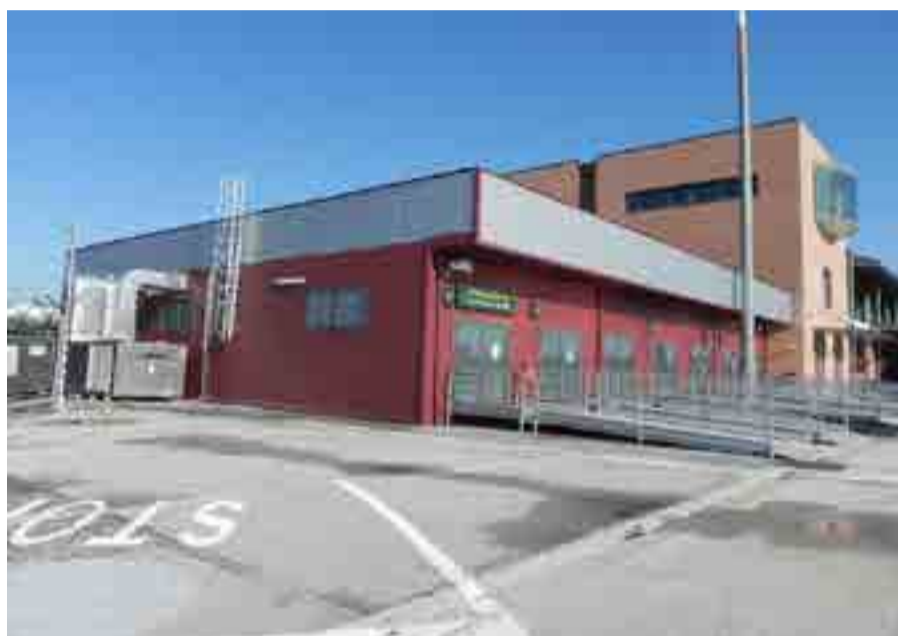
Aeroporto di Treviso (TV)