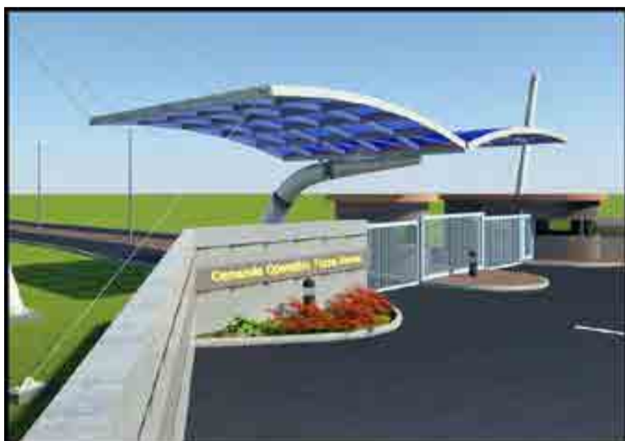
Caserma di Poggio Renatico (FE)

PREFABBRICATI FERROCOSTRUZIONI s.r.l. EDILIZIA MODULARE INDUSTRIALIZZATA VIA S.GIACOMO, 133 PORTOGRUARO (VE) ITALY TEL. ++39 0421 270270 e-mail info@prefabbricatiferrocostruzioni.it prefabbricatiferrocostruzioni@ticertifica.it www.prefabbricatiferrocostruzioni.it